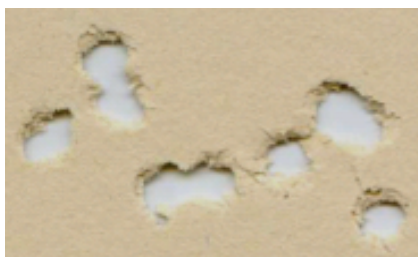
Конкурент из Европы