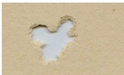
H&N Baracuda Match 4,5mm