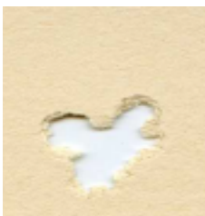
H&N Baracuda Match 5,5mm