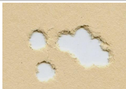
H&N Field Target Trophy 6,35mm