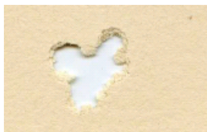
H&N Baracuda 4,5mm