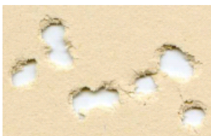
Конкурент из Восточной Европы