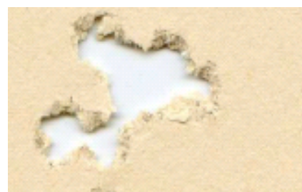
Конкурент из Южной Европы