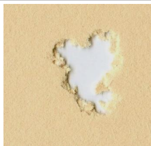
H&N Baracuda 5,5mm