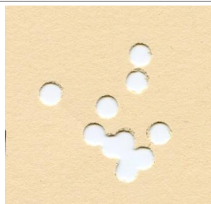
H&N Hollow Point 5,5mm